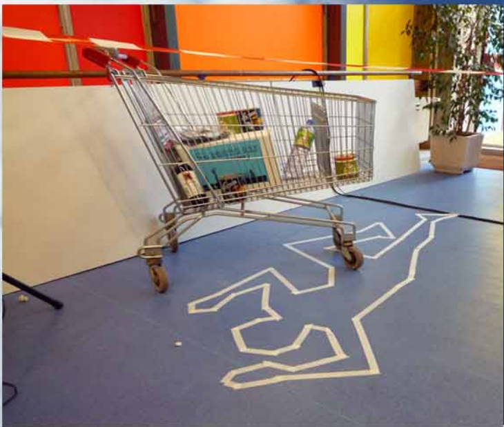
Accident de caddie suite à une vente flash