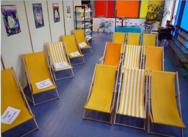
Une salle de projection du film